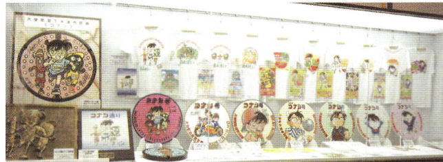
コナン・ザ・コレクション 「シャツなど貴重なコレクションがいっぱい。」