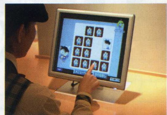
ゲームに挑戦! 画面にタッチして楽しんでね。