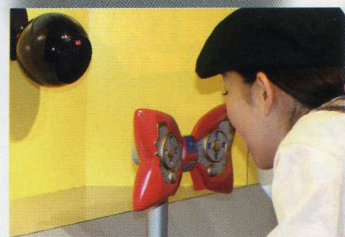
蝶ネクタイ型変声機 キミの声が変わるよ! 試してね。