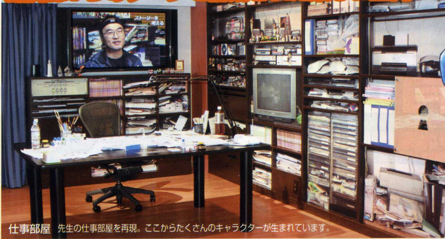
仕事部屋 先生の仕事部屋を再現。ここからたくさんのキャラクターが生まれています。