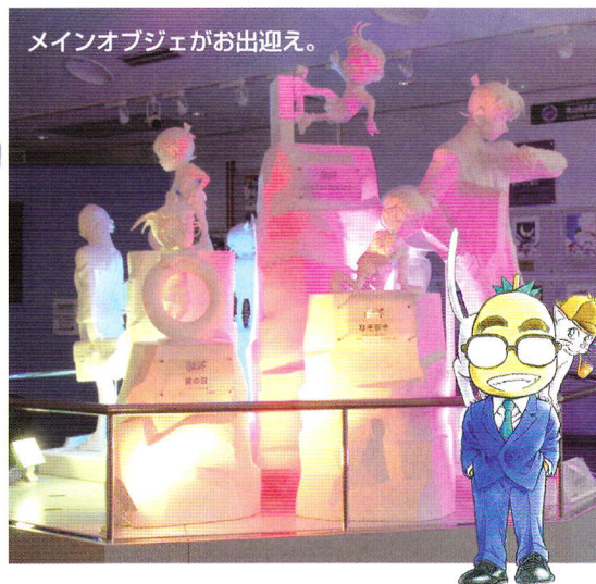
メインオブジェがお出迎え。

町内のコナン通りでは、さまざまなオブジェに会うことができます。コナン大橋のレリーフや、マンホールにもキャラクターを見ることができます。