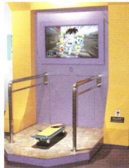
ターボエンジン付スケートボード スケボーに乗って、「コナンの里」をぐるっと一回り!