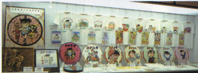
コナン・ザ・コレクション Tシャツなど貴重なコレクションがいっぱい。