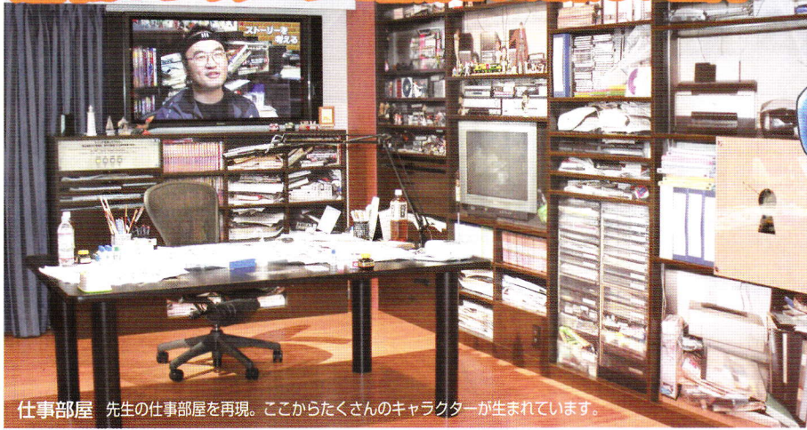
仕事部屋 先生の仕事部屋を再現。ここからたくさんのキャラクターが生まれています。