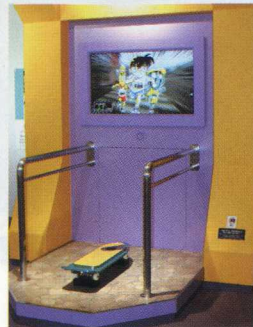
ターボエンジン付スケートボード スケボーに乗って、「コナンの里」をぐるっと一回り!