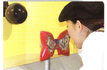
蝶ネクタイ型変声機 キミの声が変わるよ! 試してね。